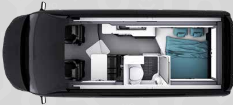
YUCON 54 B

Alle Infos zur Serienausstattung findest du ab Seite 17.