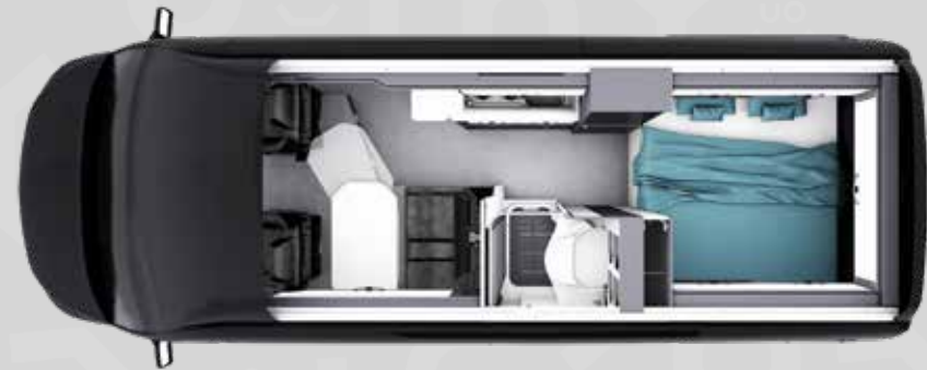
YUCON 60 B