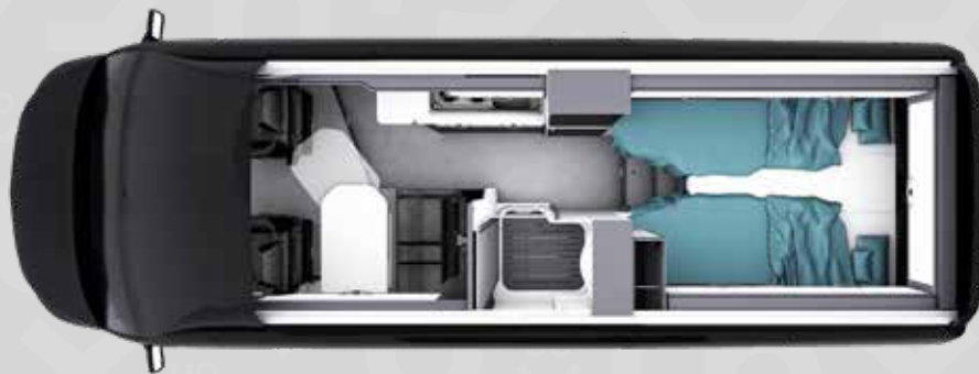
YUCON 63 G