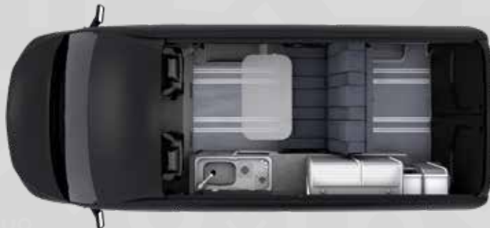
YUCON 55 SB

Alle Infos zur Serienausstattung findest du ab Seite 27.