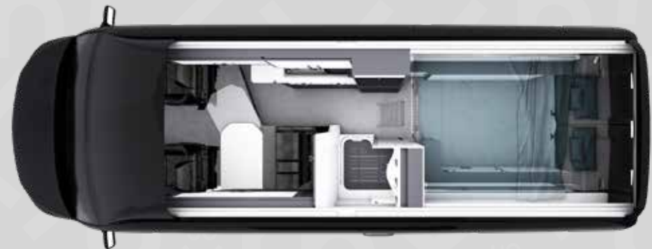
YUCON 63 H