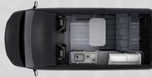
YUCON 51 FB