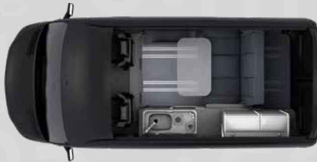
YUCON 51 SB